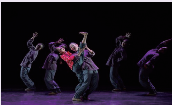
图 2-4-2 舞蹈《中国妈妈》图片