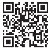
舞蹈表演与 道具运用

上述例证表明，优秀的舞蹈作品除需要准确而生动的舞蹈身体语言、精湛的技术技巧、优美的音乐