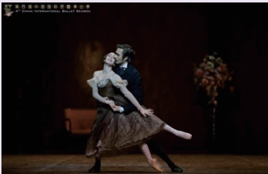
图 2-4-1 芭蕾舞剧《奥涅金》剧照