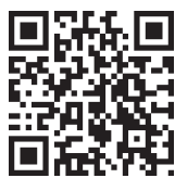
优秀舞者的 综合素养

一个优秀的舞蹈作品，往往是编导通过多年积累、打磨而成，而真正为我们展现在舞台上的则是舞者。优秀的舞者常常成为众人追捧的对象，如观众会不远万里去欣赏乌兰诺娃、玛戈·芳婷等首席舞者的演出。同一个作品，由不同的舞者演绎，往往呈现不同的艺术效果。二度创作中，舞者将自己对作品的理解、感悟，自身的能力与技术融入其中，从而丰满作品的内容、结构、人物情感，还展现出舞者独具特点的舞台形象。