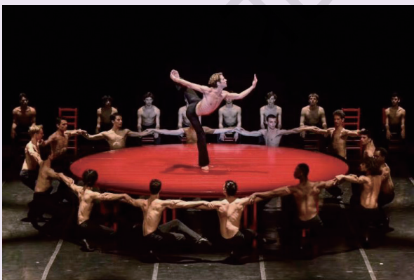
图 2-4-3 现代芭蕾《波莱罗》图片