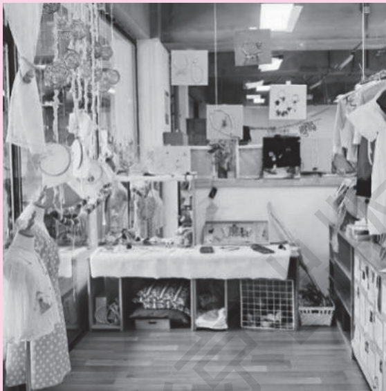
图 1-12 瑞吉欧环境

瑞吉欧幼儿园强调创设环境要遵循教育性原则、家庭社区性原则、动态性原则、整体性原则。(图 1-12)