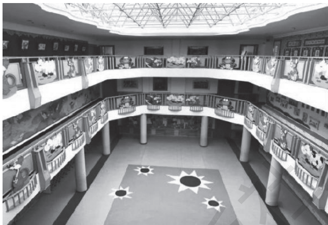
图 1-2 幼儿园室内环境

幼儿园室内环境是幼儿园教育环境最主要的组成部分，包括园舍的内部门厅、走廊、楼梯、活动室和生活区等。室内环境布置科学合理，富有感染力，将为幼儿的身心发展提供重要的保证，幼儿园应该结合自身的实际情况，充分利用资源，创设鲜明有特色的室内环境，既应该经济适用，又应该接近幼儿的生活。（图 1-2）