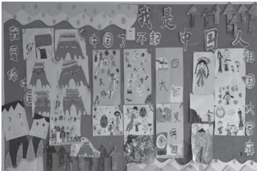
图 1-6 “我是中国人”主题墙

增强爱祖国爱家乡的情感，提升学习探究能力，因此幼儿园环境对幼儿的认知有着引导、启迪作用。(图 1-6)