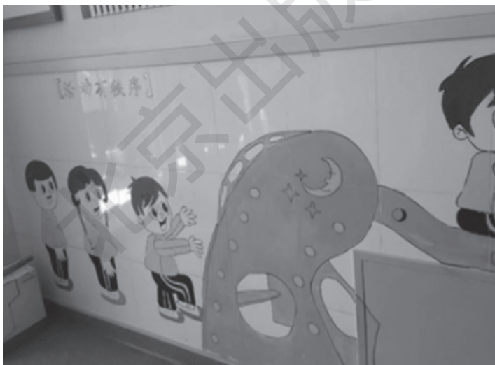
图 1-8 “有序排队”常规墙

在幼儿园安全环境创设中，“安全提示语”是不可缺少的内容。幼儿园的活动空间、生活空间、卫生间、盥洗室、楼梯、走廊等地方，都应设计醒目的、便于幼儿识记的安全提示。例如，小心地滑、安全出口、上下楼梯口右走、保持微笑、你好、再见等。但是需要注意的是这些提示语需要用图或图文并茂的形式来呈现。（图 1-8）