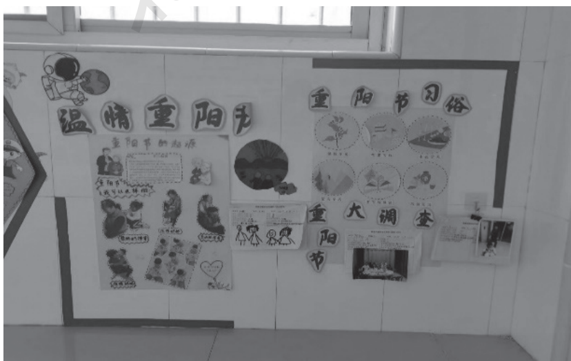
图 1-7 “温情重阳节”主题墙

幼儿处于社会性发展的初级阶段，多体现为以自我为中心，所以引导幼儿提高人际交往和社会适应能力是幼儿园的重要目标和任务。幼儿园环境创设的内容、活动空间的安排、活动材料的投放及其营造的氛围都影响幼儿社会性的发展。例如，在“温情重阳节”主题活动中，教师引导幼儿知道重阳节是我国民间传统节日之一，知道重阳节的由来及其独特的活动和风俗习惯，通过体验活动引导幼儿懂得“敬老爱老”是中华民族的传统美德。(图 1-7)