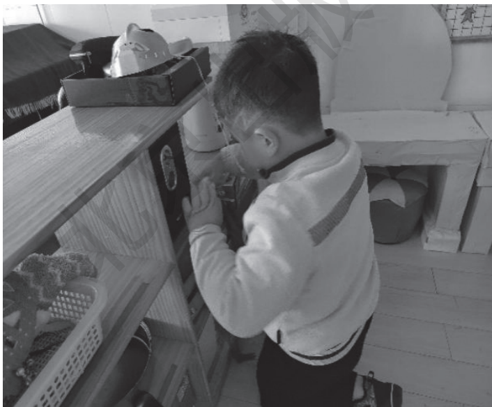
图 1-10 幼儿区域整理

幼儿参与原则是指幼儿园环境创设的过程应是教师与幼儿共同合作、共同参与的过程。在环境创设的过程中，教师要创造条件，引导幼儿积极参与环境创设，引导幼儿在环境中主动操作，有表现能力的机会和条件。著名教育家陈鹤琴曾指出：“用儿童的双手和思想布置的环境，会使他们更加深刻地理解环境中的事物，也会使他们更加爱护环境。”幼儿参与幼儿园环境创设具有重要的意义，既可以培养幼儿的主体精神、责任感及合作意识，又可以获得新知识、新经验，锻炼动手能力。（图 1-10）