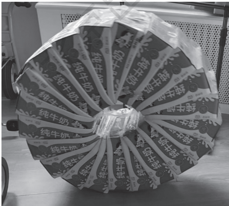
图 1-11 废物利用

环保经济性原则主要是指在材料的选取与投放上要关注生活化，取之自然、环保绿色的概念。在实践中，可以发动广大师幼、家长共同收集有地方资源特色、环保生态、可持续使用的自然物、生活物品，不盲目攀比，不盲目追求高档化的装修、设施设备，在保证安全、卫生的前提下，因地制宜，一物多用，变废为宝。（图 1-11）