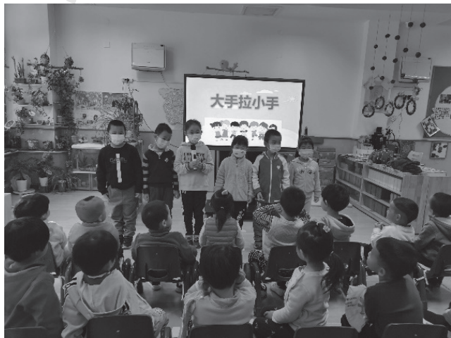
图 1-5 幼儿园心理环境

幼儿园心理环境是指幼儿园内影响幼儿身心发展的一切心理因素的总和。幼儿园心理环境是一种隐性环境，它是由幼儿园的文化、制度、人际关系等要素交织在一起形成的一种氛围或感觉。（图 1-5）