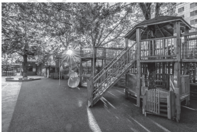
图 1-3 幼儿园室外环境

幼儿园室外环境包括主体建筑、园门、园区绿化区域和游戏活动场地等，其中，室外游戏活动场地又包括室外游乐设施区、体育活动区、戏水玩沙区和种植饲养区。亲近自然是幼儿的天性，幼儿园的每个地方，甚至角落都可以成为幼儿学习的场所。幼儿园室外环境设计，要从幼儿的视角出发，充分利用空间，保留自然生态的本色，给予幼儿喜欢的室外环境。（图 1-3）