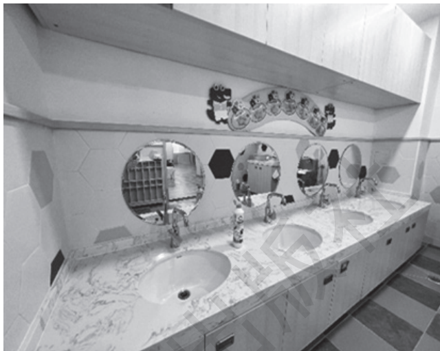
图 1-4 幼儿园物质环境

从环境的范围来看，幼儿园物质环境可分为：整个幼儿园的环境、整个活动室的环境和区域活动环境。从三维空间来看，可分为：空中环境、墙面环境和地面环境。从性质上来看，可分为：自然环境和人工环境。（图 1-4）