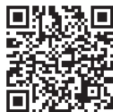
裴斯泰洛齐的教育心理学化

瑞士民主主义教育家裴斯泰洛齐(Johan Heinrich Pestalozzi)是西方教育史上首位提出“教育心理学化”的教育家。教育心理学化理论的主要内容包括：教育适应儿童的心理发展、教育内容心理学化、教学原则和教学方法的心理学化等 ② 。这种建立在心理学化道路上的思想为教育的有效普及和实施提供了理论指导与教学方法，近代众多教学、课程的思考与发展均建立在教育心理学化这一基础上。教育心理学化的教学法能够体现音乐课程的实践性特点，并为兴趣在音乐学习中的重要性提供了理论支撑。在教学过程中，心理学对学生自我能动性的调动与启发的观点也融入音乐教学的各个环节当中，引导学生主动参与音乐学系中的各项活动并进行一定程度的创造。音乐课程不同于其他学科的教学形式，是一种综合型教育实践活动，教师与学生团体、个体与个体和声部与声部之间的互动关系是音乐教学形式的特点所在。儿童之间的人际交往不仅是教育本身的培养个体社会性的内在要求，也是儿童适应社会，在未来更好地持续发展的基础。因此，音乐课程也可与其他学科相结合教学，人与人之间的心理互