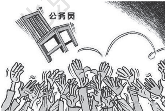
图 1-2 公务员

再次，期望不合时宜。有些大学生在就业前很少接触社会，自以为历经“十年寒窗”，有知识、有能力、懂技术，在择业时热衷于寻找较为稳定、经济收入高、地域条件好、环境舒适的企业，极不情愿选择条件艰苦、地域偏僻、信息闭塞、交通不便的地方去锻炼。事实上，他们的知识技能远远达不到所期望职业的现实要求，导致最后出现“高不成，低不就”的现象（图 1-2）。