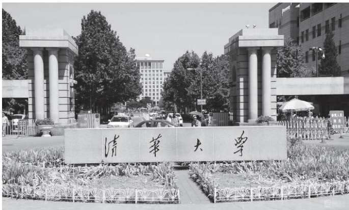
图 1-1 大学