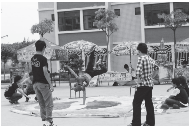
图 1-7 大学生社团活动

就社团活动的意义而言,一方面,大学生社团活动为大学生成才提供了良好的环境和条件,通过社团活动能够锻炼大学生的各种能力,有利于大学生的全面健康成长;另一方面,社团活动可以深化学生对社会的认识,使学生发现理论与实际的差别,培养科学研究的意识和寻求真理的乐趣。另外,社团活动还为大学生搭建自我管理、自我教育、自我服务的平台,从而增强大学生的责任感使命感和创新创业意识、成长和成才意识等。