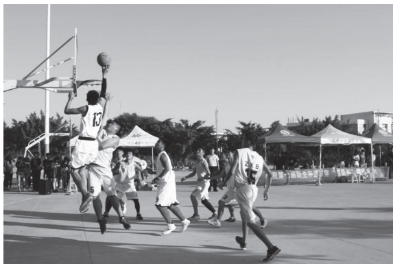
图 1-5 大学生篮球赛

②体育竞赛活动。体育竞赛活动主要以促进学生身体健康、激发学生竞技精神为目的，各种各样的体育比赛如运动会、篮球赛（图 1-5）、足球赛等，促使学生加强体育锻炼，在竞争中收获运动的快乐。