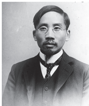
图 1-14 北京大学前校长蔡元培

北京大学前校长蔡元培（图 1-14），以“思想自由，兼容并包”为办学方针，北大从此名高声隆，人才辈出，莫不与这种学术民主之传统相关。如果学者和教授丧失了思想和学术的自由，那就不仅是学术与大学的灾难，也是国家与民族的灾难了。