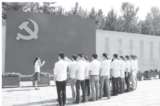
图 1-3 大学生入党宣誓