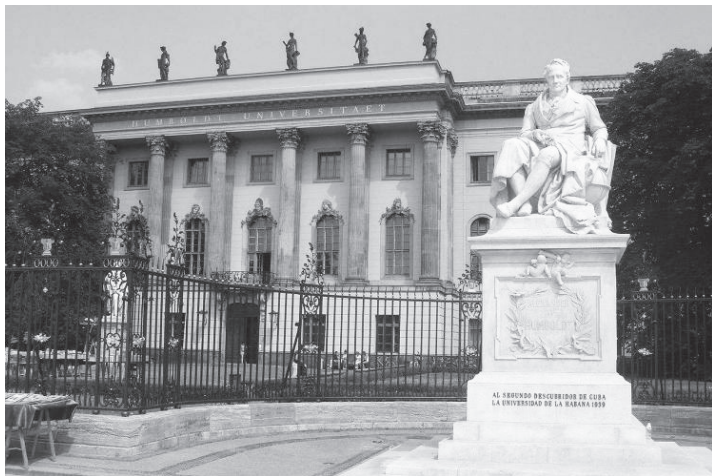
图 1-10 德国的柏林大学