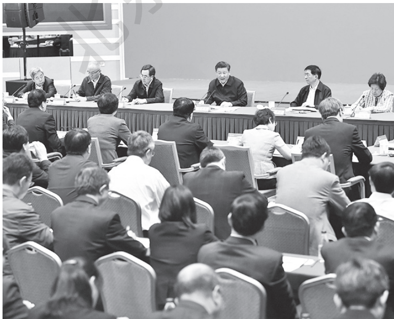
图 1-11 习近平同志在北大建校 120 周年师生座谈会上讲话

我国也在积极探索具有中国特色的高等教育，并提出适应中国现代化建设要求的大学理想。江泽民同志在庆祝北大建校一百周年大会的讲话中，提出了我国社会主义大学的理想，他说“这样的大学，应该是培养和造就高素质的创造性人才的摇篮，应该是认识未知世界、探求客观真理、为人类解决面临的重大课题提供科学依据的前沿，应该是知识创新、推动科学技术成果向现实生产力转化的重要力量，应该是民族文化与世界先进文明成果交流借鉴的桥梁”。习近平同志在北大建校 120 周年师生座谈会上讲话（图 1-11）：大学是立德树人、培养人才的地方，是青年人学习知识、增长才干、放飞梦想的地方。