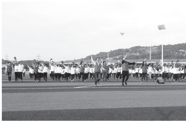
图 1-8 大学生志愿者活动

(4) 志愿者活动。随着社会的发展,大学生志愿者活动日益成为大学生在实践中经受锻炼、完善自我的新课堂。新世纪的大学生,应承担起自己的社会责任,参与志愿服务,既是在帮助他人,服务社会,同时也是在传递爱心与传播文明,在为他人送去玫瑰的同时,也收获到了服务他人、自我成长的芬芳。