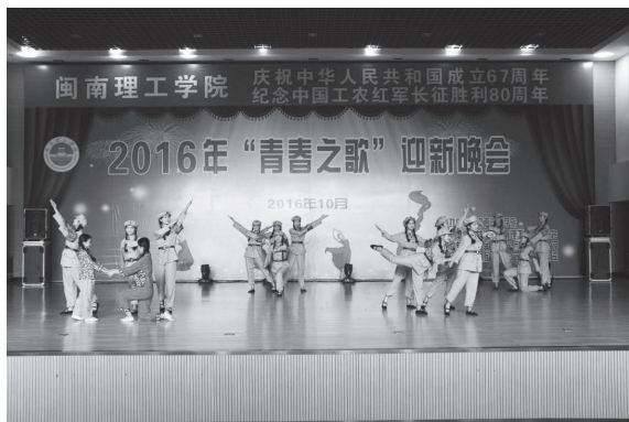
图 1-6 大学生文艺活动

(3) 社团活动。大学生社团(图 1-7)是根据学生自己的爱好和成才需要,自发组织起来的学生自我管理的组织。它分散在大学校园中,在共同目标的鼓舞下,社团成员集思广益,互相鼓励、互相配合,充分发挥集体的智慧和力量。社团活动为大学生提供了认识社会、锻炼自己的有效平台,它是大学生实现自我教育、自我管理的有效方式,是连接学校与学生的桥梁与纽带,以培养学生兴趣、增长知识、提高技能、陶冶性情为目的,为学生综合素质的拓展提供了广阔的舞台。