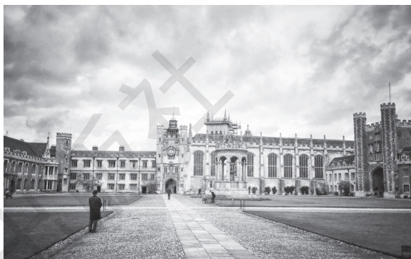
图 1-2 牛津大学