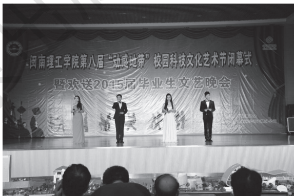
图 1-4 大学生文化活动

①文化类活动。文化类活动是指能体现知识性、专业性或文化性的活动，此类活动相当于大学生学习的第二课堂，将专业知识以更加活泼、更加有趣的形式转化给学生。活动形式例如演讲赛、诗歌朗诵会、文化沙龙、专题讲座等，活动在提升学生知识文化素养的同时，让大学生体会到自我探索与学习的快乐（图 1-4）。